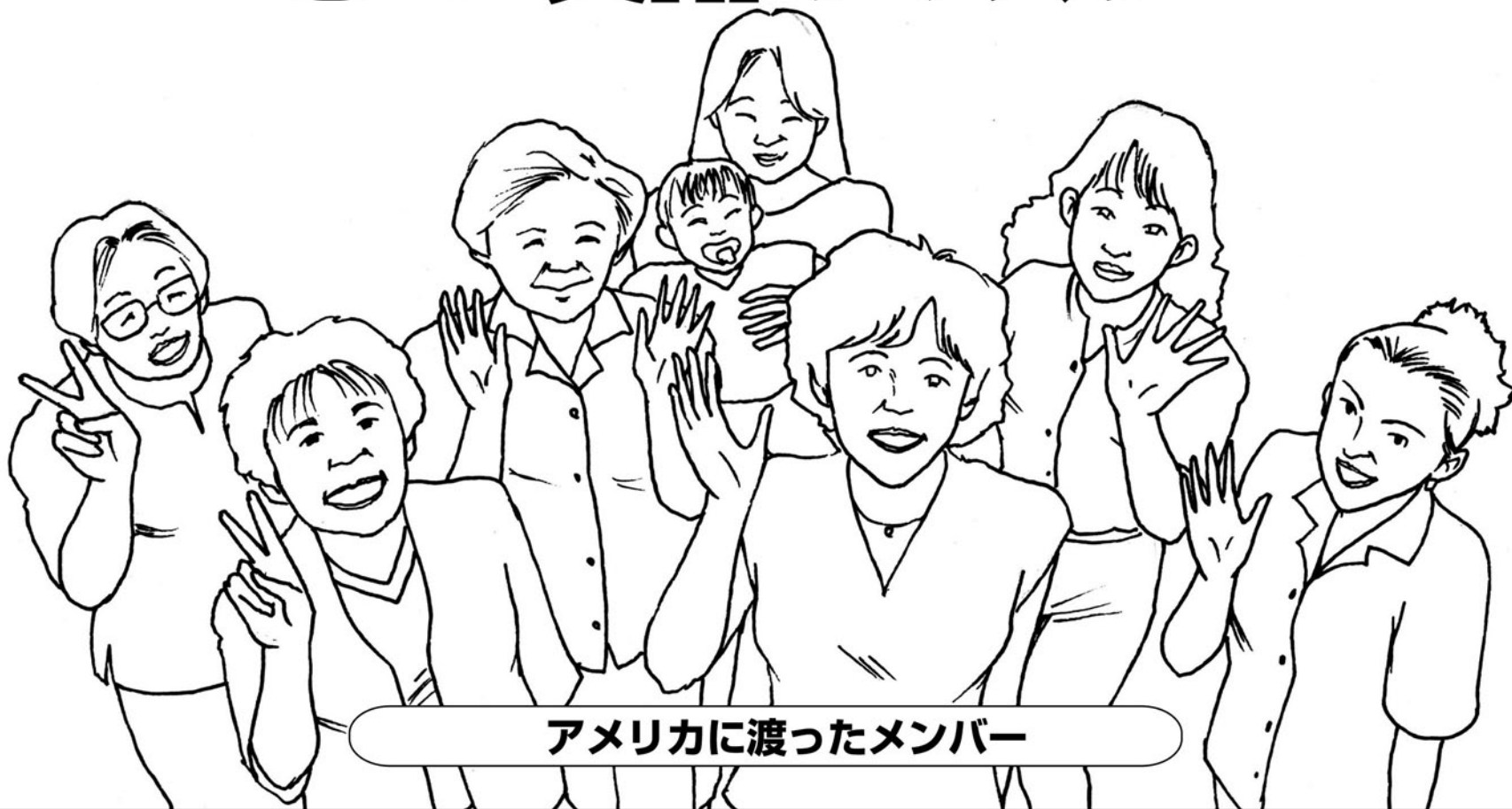
アメリカに渡ったメンバー